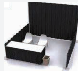
標準ブースイメージ

・来場者バッジスキャナー (Emperia) ・Exhibitor Dashboard